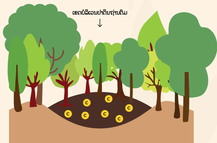
ພືດພັນເຕີບໃຫຍ່ຢູ່ເທິງເນີນດິນຖ່ານຕົມ ແລະ ກໍ່ເກີດມີລະບົບນິເວດດິນຊຸ່ມສະເພາະ.