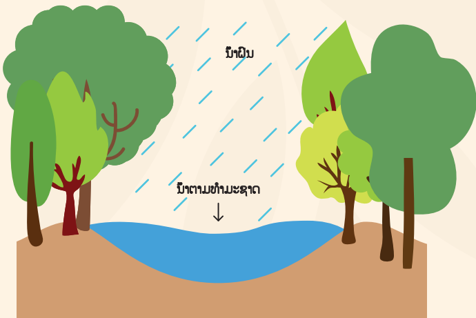
ກໍ່ໃຫ້ເກີດປະລິມານນ້ຳຈໍານວນຫຼາຍ.

ດິນຖ່ານຕົມແມ່ນລະບົບນິເວດເຂດດິນບໍລິເວນນ້ຳທີ່ເກີດຢູ່ໃນສະພາວະນ້ຳຖ້ວມຂັງ ເພື່ອປ້ອງກັນການຢ່ອຍສະຫຼາຍຂອງພືດ. ດັ່ງນັ້ນ, ການຜະລິດອິນຊີວັດຖູຫຼາຍກ່ວາ ການຢ່ອຍສະຫຼາຍ, ເຊິ່ງສິ່ງຜົນເຮັດໃຫ້ມີການສະສົມຂອງດິນຖ່ານຕົມ.