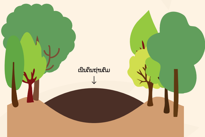
ເນີນດິນຖ່ານຕົມມີການຂະຫຍາຍຕົວຈາກການສະສົມຂອງອິນຊີວັດຖູ ແລະ ການດູດຊຶມນ້ຳ.