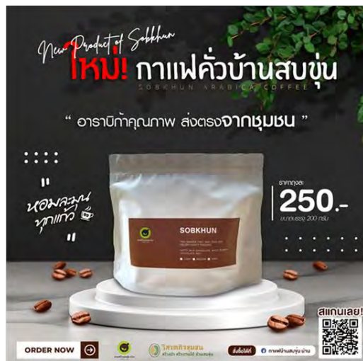
สบขุ่นโมเดล จ.น่าน