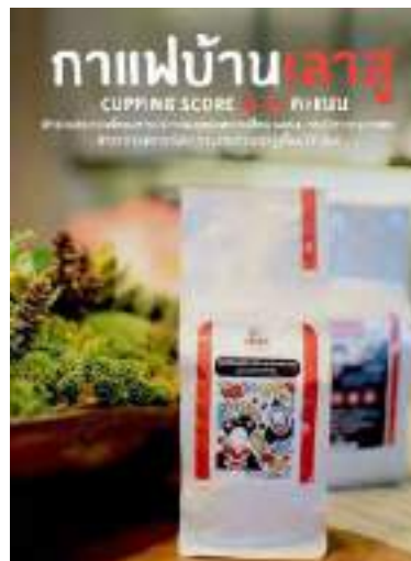
บ.เลาสุ อ.แจ้ห่ม จ.ลำปาง