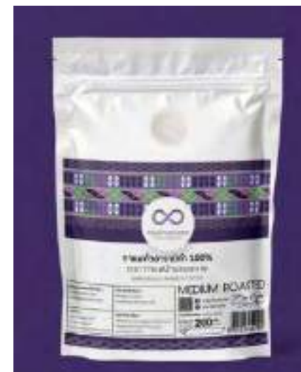
บ.แม่วาก อ.แม่แจ่ม จ.เชียงใหม่