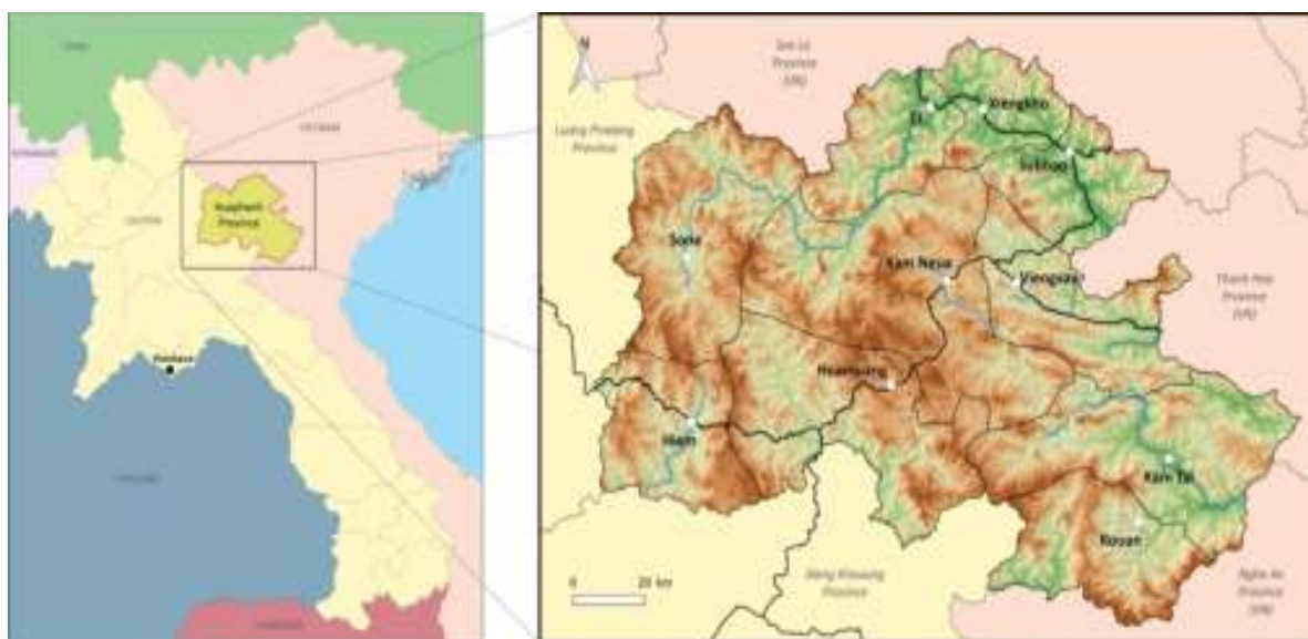
Figure 1: Map of Houaphanh province

Houaphanh province consists of 10 districts, 728 villages, 51,208 households and 300,588 people (2020) with 9 ethnic groups. About 90% of the population lives in rural areas, mostly farmers - farming, shifting cultivation, mixed farming, growing maize, vegetables, raising livestock and selling non-timber forest products (NTFPs). According to Decree 348 /GoL, Houaphanh Province has 473 poor villages covering 64.97% of the total number of villages and 16,860 poor families covering 32.92% of the total number of families. In addition, there are 36,610 better-off households, accounting for 71.49% of the total households in the province.