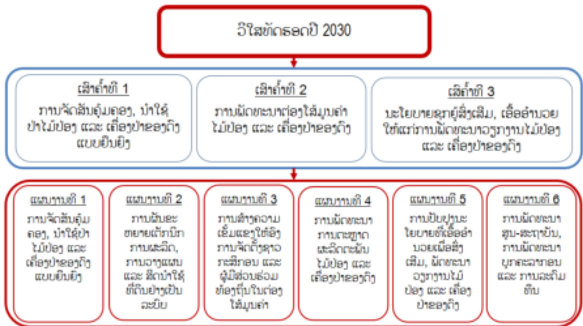
ກອບທິດທາງເພື່ອການພັດທະນາວຽກງານໄມ້ປ່ອງ ແລະ ເຄື່ອງປ່າຂອງດົງ ຂອງແຂວງຫົວພັນ ໄລຍະທີ III (2021-2025)

ປ່າໄມ້ປ່ອງ-ເຄື່ອງປ່າຂອງດົງຂອງແຂວງຫົວພັນ ໄດ້ຮັບການຈັດສັນ, ຄຸ້ມຄອງ, ນຳໃຊ້ແບບຍືນຍົງ, ເປັນເສດຖະກິດ ແລະ ມີປະສິດທິຜົນ ໂດຍການມີສ່ວນຮ່ວມຂອງຊຸມຊົນ ແລະ ທຸກພາກສ່ວນທີ່ກ່ຽວຂ້ອງ, ປະກອບສ່ວນຢ່າງເປັນຮູບປະທຳເຂົ້າ ໃນການຫລຸດຜ່ອນຄວາມທຸກຍາກ ແລະ ພັດທະນາຊືນນະບົດຕາມທິດທາງພັດທະນາສີຂຽວ. ສິ່ງເສີມ ແລະ ພັດທະນາຕ່ອງໂສ້ ມູນຄ່າໄມ້ປ່ອງ-ເຄື່ອງປ່າຂອງດົງ, ທີ່ຕິດພັນກັບການສ້າງຄວາມອາດສາມາດຂອງບຸກຄະລາກອນ, ກຸ່ມຜູ້ຜະລິດ, ຜູ້ປະກອບການ ທ້ອງຖິ່ນ, ພ້ອມທັງມີນະໂຍບາຍຕ່າງໆທີ່ເອື້ອອຳນວຍຂອງພາກລັດຢ່າງຮອບດ້ານ ແລະ ມີຈຸດສຸມ.