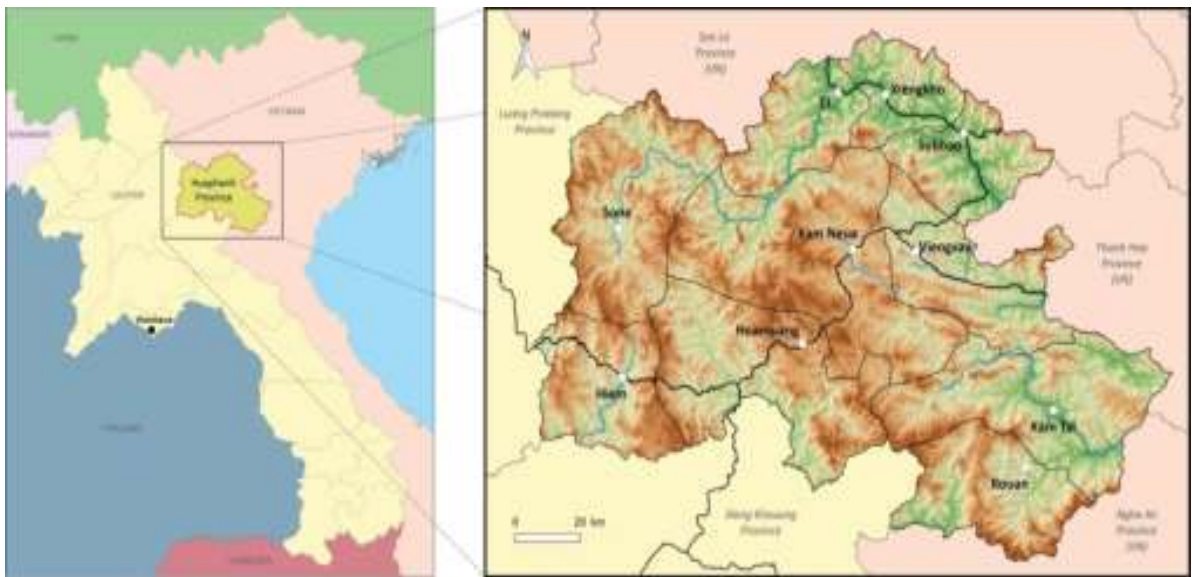
ຮູບທີ 1: ແຜນທີ່ຂອງແຂວງຫົວພັນ

ແຂວງຫົວພັນ ປະກອບມີ 10 ເມືອງ, 728 ບ້ານ, 51.208 ຄອບຄົວ, ຜົນລະເມືອງທັງໝົດ 300.588 ຄົນ (2020) ແລະ ມີ 9 ຊົນເຜົ່າ. ປະຊາກອນປະມານ 90% ແມ່ນອາໄສຢູ່ເຂດຊົນນະບົດ ຊຶ່ງສ່ວນຫຼາຍແມ່ນຊາວກະສິກອນ-ເຮັດນາ, ເຮັດໄຮ່, ກະສິກໍາປະສົມ, ປູກສາລີ, ປູກຜິດຜັກ, ລ້ຽງສັດ ແລະ ຂາຍເຄື່ອງປ່າຂອງດົງ. ອີງຕາມດໍາລັດ 348/ລບ, ແຂວງຫົວພັນ ມີບ້ານທຸກຍາກ 473 ບ້ານ, ກວມເອົາ 64,97% ຂອງຈໍານວນບ້ານທັງໝົດ ແລະ ມີຄອບຄົວທຸກຍາກ 16.860 ຄອບຄົວ, ກວມເອົາ 32,92% ຂອງຈໍານວນຄອບຄົວທັງໝົດ. ນອກນັ້ນ, ຍັງມີຄອບຄົວພັດທະນາ 36.610 ຄອບຄົວ, ກວມເອົາ 71,49% ຂອງຈໍານວນຄອບຄົວທັງໝົດ.